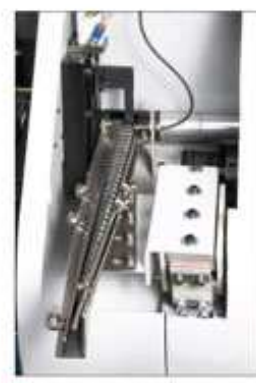
● 步驟1: 進料 Step 1 : Loading