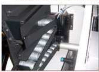
● 步驟1: 進料 Step 1 : Loading