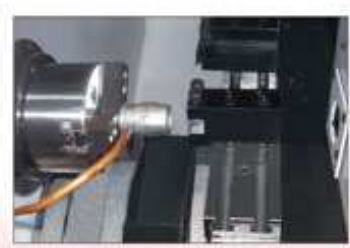
● 步驟4: 工件車削完成接料器準備接料 Step 4 : Part catcher device come to unloading the material