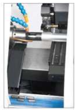
● 步驟2: 送料至主軸 Step 2: Lading material to spindle