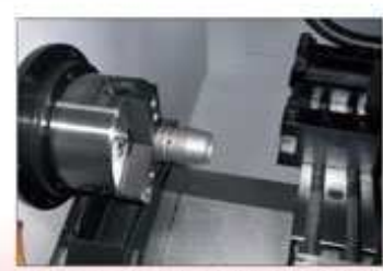
● 步驟3: 主軸夾持工件準備車削 Step 3 : Chuck clamp the material for cutting