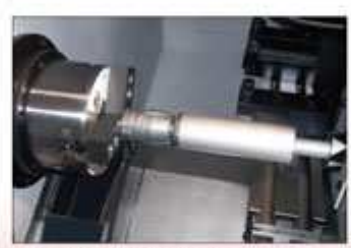
● 步驟2: 送料至主軸 Step 2 : Lading material to spindle